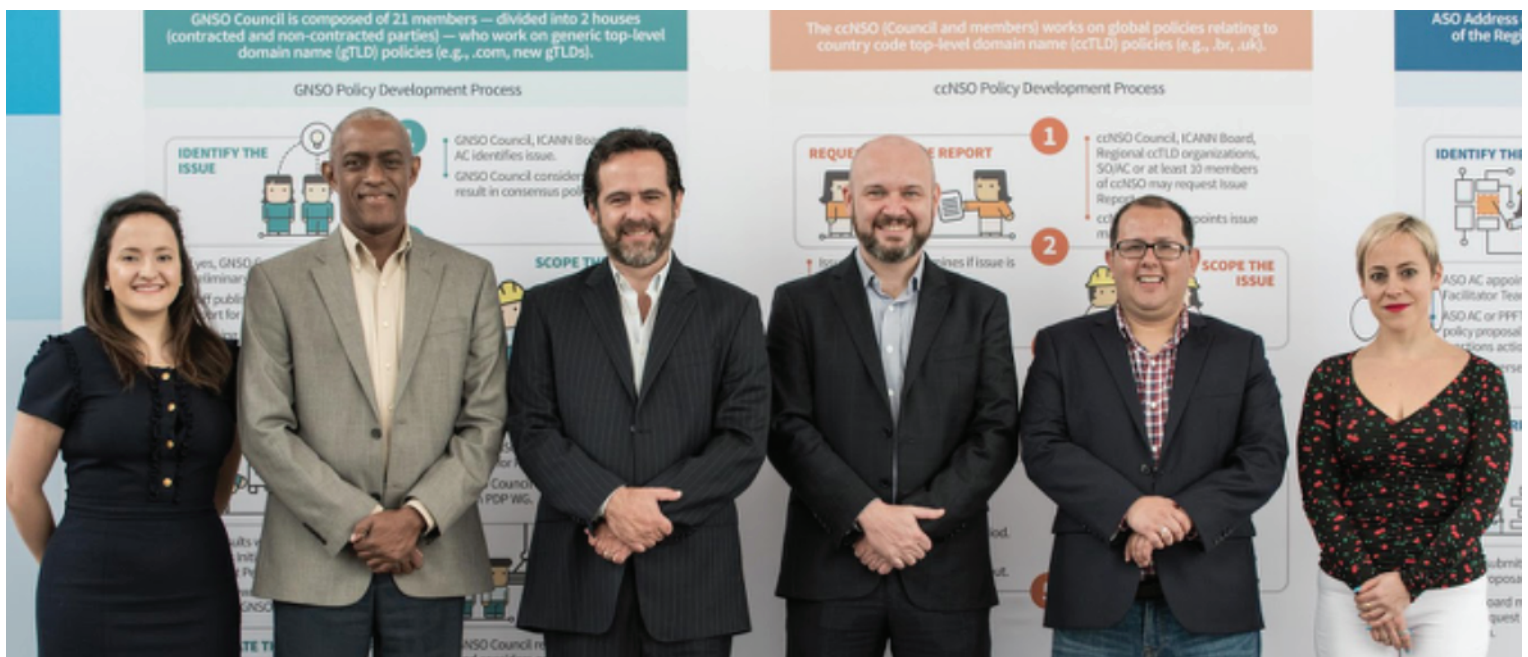
Conozca a nuestro equipo de Participación Global de Partes Interesadas (GSE) y Comunicaciones de LAC.

Una de las diferencias más significativas entre antes y después de la Estrategia de LAC es la existencia de un equipo regional. Antes de la Estrategia de LAC, la ICANN tenía un solo coordinador de enlace regional para llevar a cabo actividades de difusión y participación en la región. En la actualidad, seis profesionales componen el equipo regional, ubicado estratégicamente en diferentes países para atender mejor las necesidades de nuestras partes interesadas regionales.