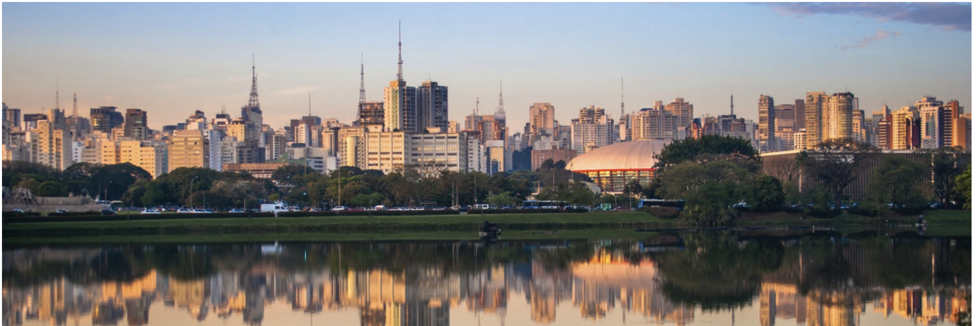
São Paulo, Brazil, sede de uno de los eventos regionales en 2015.