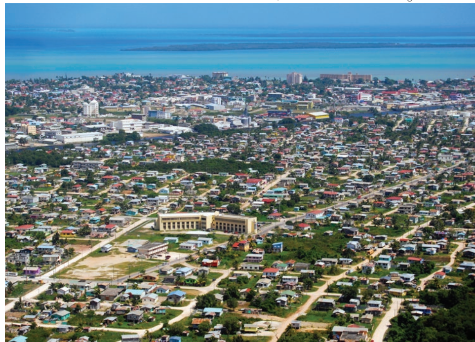
Belize, sede de uno de los eventos regionales en 2015.

Estos sentimientos han sido expresados en varias oportunidades por los ministros gubernamentales, proveedores de servicios de Internet, miembros de la sociedad civil e incluso por organizaciones tales como la OOCUR y la CTU. Muchas organizaciones regionales han incluso solicitado a la ICANN que volvieran a sus eventos, de manera continua, para participar en actividades de desarrollo de capacidades con sus miembros.