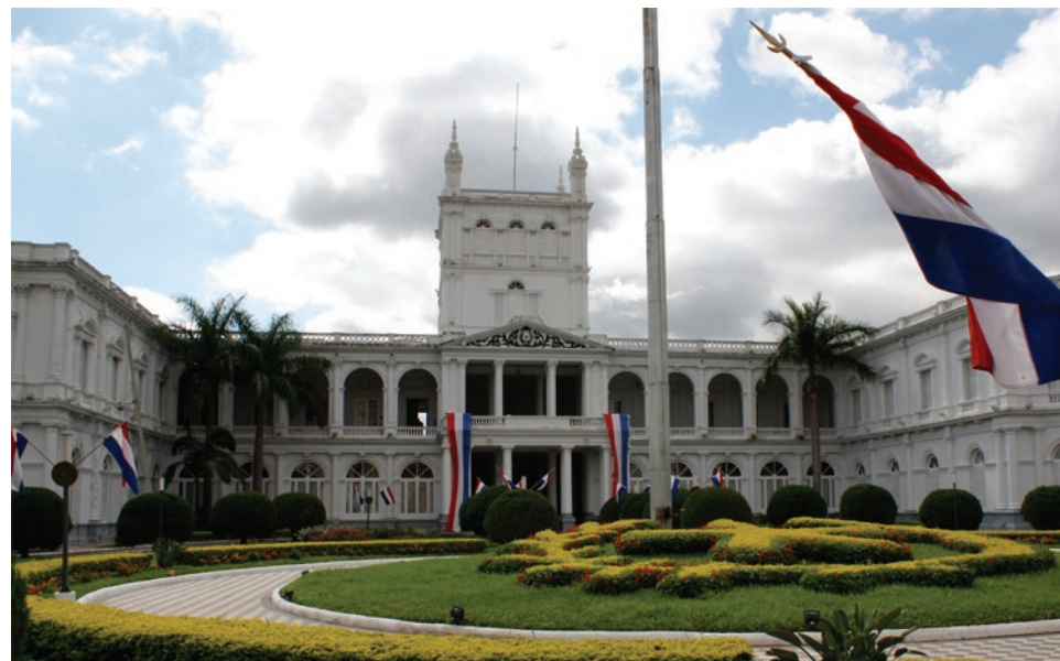
Asunción, Paraguay, sede de uno de los eventos regionales en 2015.

Muito Obrigado (muchas gracias) a la comunidad brasileña por este fantástico 2015 y ¡esperamos tener un 2016 aun mucho más productivo!